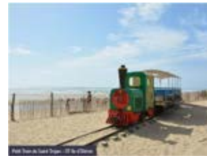
Fort Boyard, Île d'Aix, Charente-Maritime