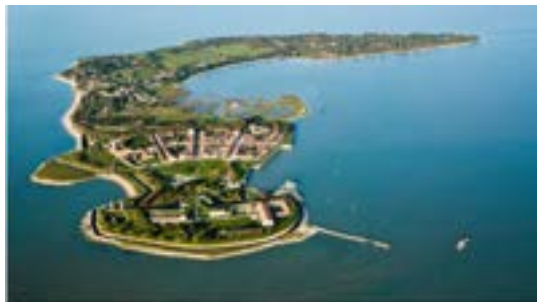
Site aérien de l'île d'Oléron, Département de la Charente-Maritime.