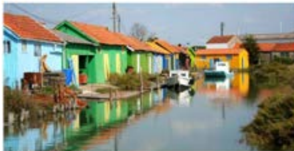
Île d'Oléron et de Bassin de Marennes