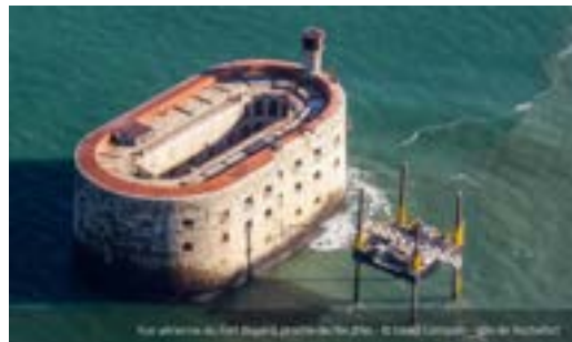
Fort Boyard, Île d'Aix, Charente-Maritime.