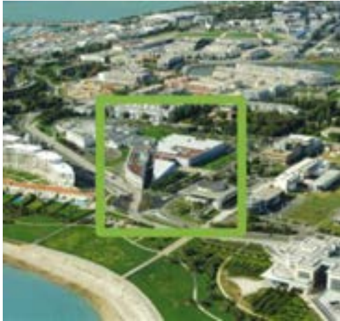
El campus universitario de La Rochelle